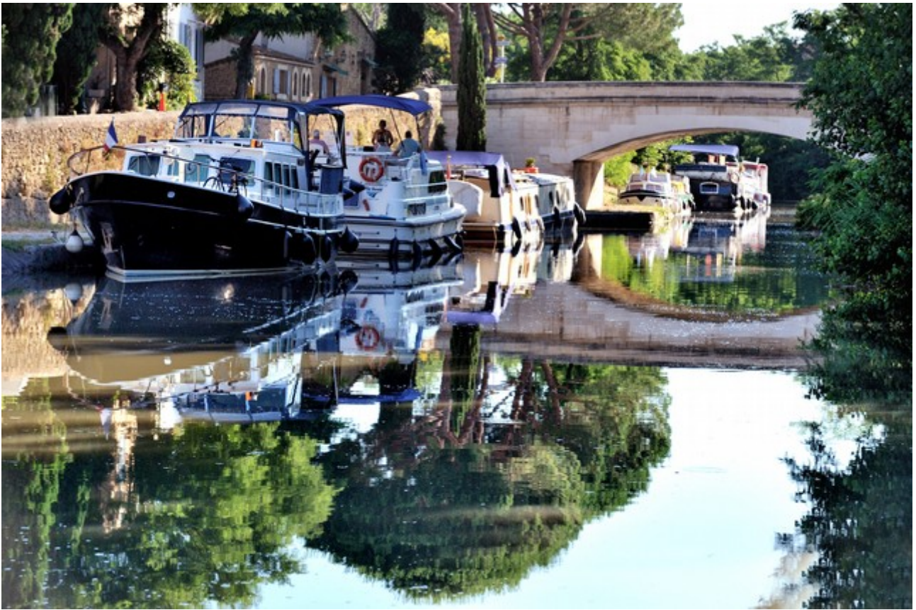
Port de Poilhes (Aude)