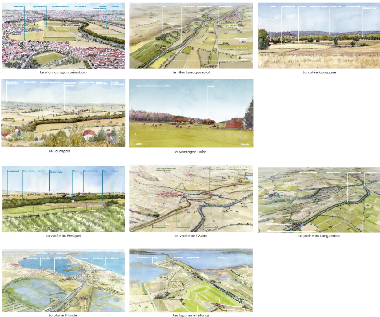
Planche-contact des ensembles paysagers du canal, présentés dans le document Le Canal du Midi et ses abords (novembre 2010, DREAL Occitanie)