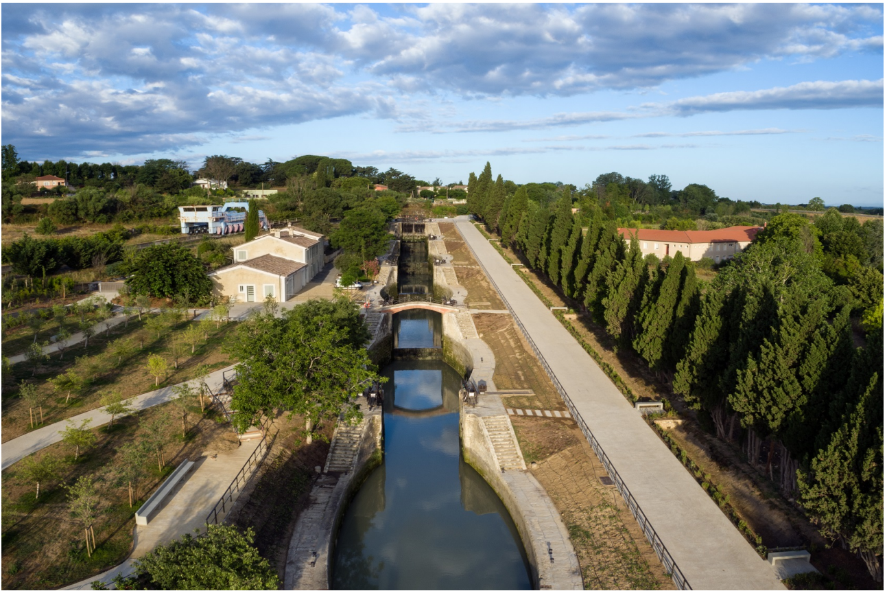
Écluses de Fonsérannes (Hérault)