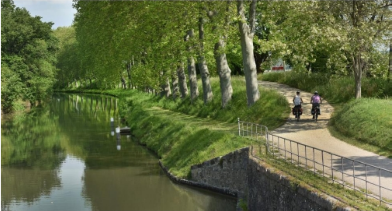
Cyclistes au bord du canal du Midi - https://www.francevelotourisme.com/itineraire/le-canal-des-2-mers-a-velo

Les travaux, qui incluent les replantations des berges, débuteront en 2020.